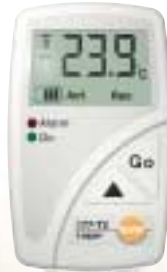
Famille d'enregistreurs testo 177

avec affichage et visualisation des limites, avec capteur interne et/ou capteur externe.