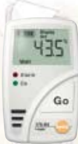
Famille d'enregistreurs testo 175

Economique, avec affichage des valeurs et des limites, mémoire sécurisée.