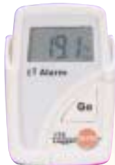
Enregistreur testo 174

Economique, avec affichage des valeurs et des limites, mémoire sécurisée.